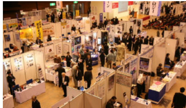
海外（中国）を含む47社のバイヤーが参加し、5,000件を超える商談が行われました (21/10)

高岡開町400年を記念し、東海・北陸地区のビジネス交流を目的とした商談会を開催しました。