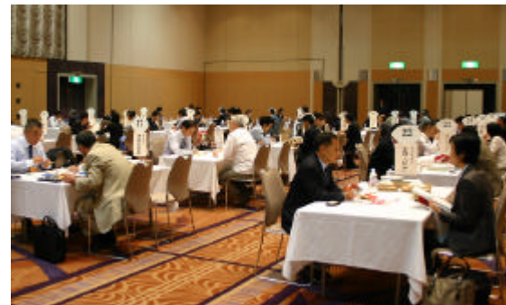
個別商談会の様子 (21/9)

41社の企業が出展、27社36名の道内外のバイヤーが参加し、展示商談会と個別商談会を実施いたしました。