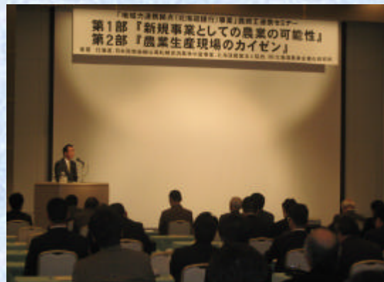
「地域力連携拠点事業 農商工連携セミナー」～平成22年1月25日開催

北海道の強みである「農業」をさらに伸ばし、道内経済の活性化に貢献するため、様々な取組みを実施しております。支援体制のさらなる充実を図るため、平成21年6月には、「アグリビジネス推進室」を新設いたしました。