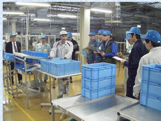
「モノづくり現場管理者実践研修会」～平成22年11月9日～11日開催

製造業の成長、経営改善に向けた支援のために、様々な取組みを実施しております。その中の一つとして、製造業の現場管理監督者を対象として、「カイゼン活動」を社内で中心となって行う人材を育成する愛知県内(2泊3日)の企業研修を実施しました。