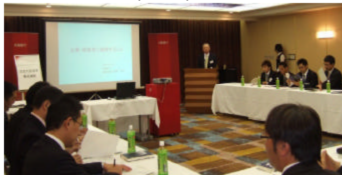
内部統制とリスク管理について学ぶ若手後継者 (21/10)

MBA取得者である行員が講師となり、中小・中堅企業の若手後継者を対象に、経営実務を学ぶための講義を行いました (全7回)。