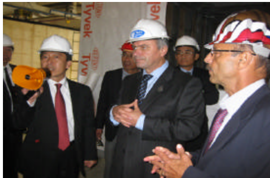
北海道銀行のお取引先様から64社80名が参加 (21/10)

道内企業が建設したモデルハウス、ロシア企業が分譲したスモールタウンや天然ガス発電所等を視察。また現地ロシア企業との意見交換やセミナーなどの交流会を行いました。