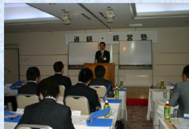
道銀経営塾の講義風景

この他にも、単独で対応することが難しい事業承継のノウハウについて、本部専門スタッフによるきめ細やかな提案を実施しております。