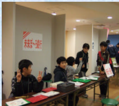
小学生の就業体験イベントに「未来ぼーろ銀行」として参画（21/11）