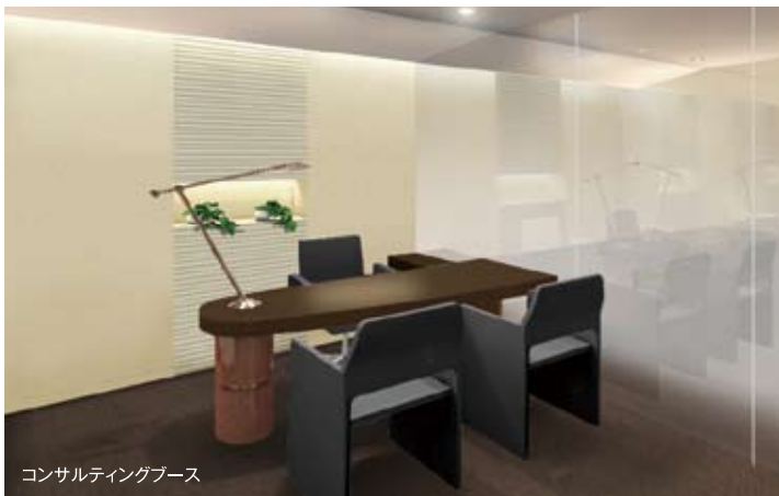
コンサルティングブース