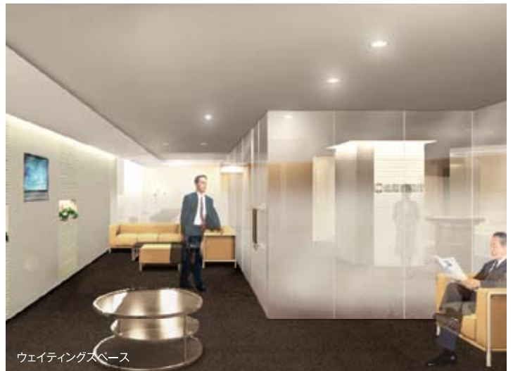
ウェイトニングスペース