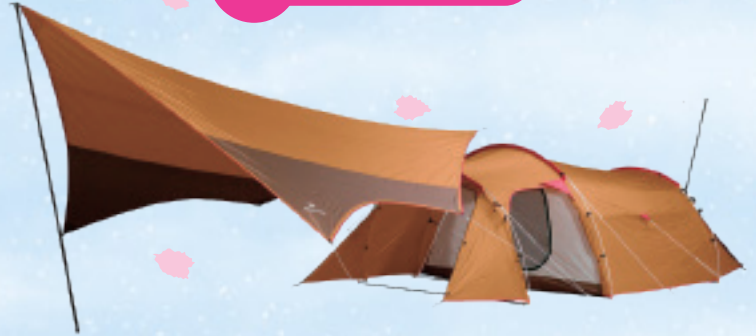
snow peak エントリーパックTT