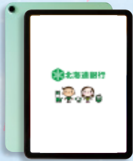
iPad Air 256GB Wi-Fiモデル