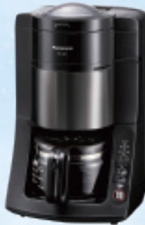
Panasonic 沸騰浄水コーヒーマーカー NC-A57