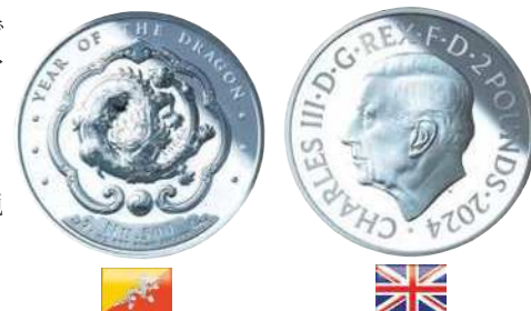
ブータン・500ニュルタムカラー銀貨 / 英国・2ポンド銀貨(表面)