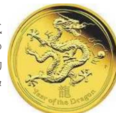
2011年発行の辰年コイン

日本人に馴染み深い「干支」をテーマに、2010年の「卯年」から毎年発行されている人気シリーズです。初年度はオーストラリア1カ国が発行する4種類でしたが、近年では複数の造幣局によるバラエティ豊富なラインアップに増加。全国の地方銀行・第二地方銀行の約半数で扱われています。また5オンス金貨をはじめとする希少価値の高い大型サイズのコレクションも近年人気を集めています。